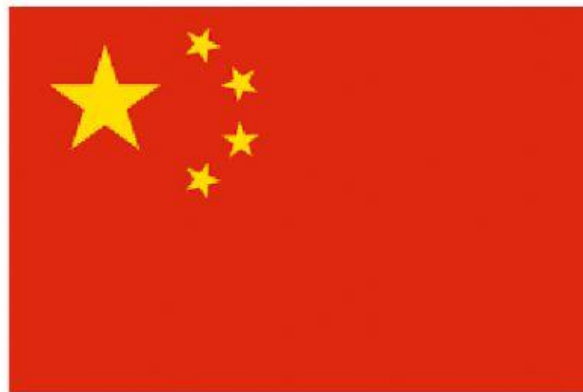
Bandiera della Cina

La bandiera cinese è completamente rossa ed ha 5 stelle gialle.