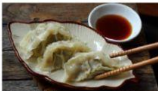
Tortellini burro e parmigiano Gnocchi alla sorrentina Ravioli al vapore