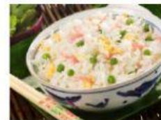
Riso alla cantonese Riso al curry Riso primavera