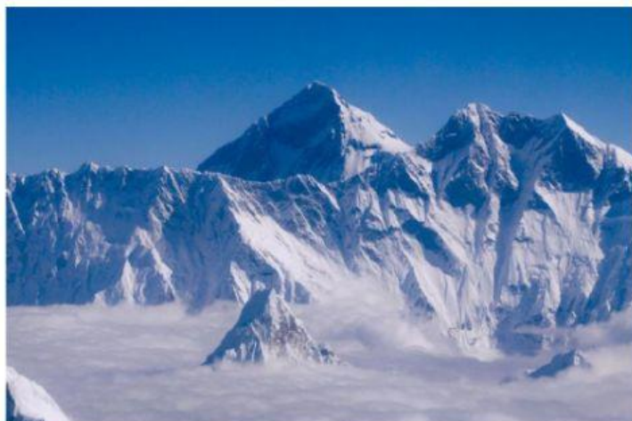
La montagna dell'Everest

Il fiume più lungo della Cina è il Fiume Azzurro , così chiamato perché le sue acque sono limpide e trasparenti.