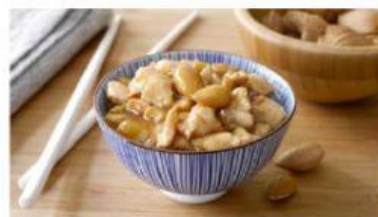
Pollo alle mandorle