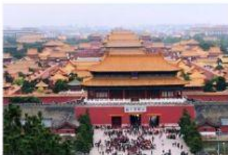
Palazzo Imperiale Palazzo del Cremlino Palazzo del Quirinale