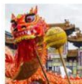
Capodanno cinese Carnevale veneziano Carro del dragone