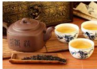
Rito della tisana Rito del tè Rito della camomilla