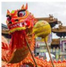
Il Capodanno Cinese

I cinesi hanno molte antiche tradizioni, alle quali sono ancora molto legati come ad esempio il Capodanno cinese , la festa delle lanterne ed il rito del tè .