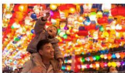
La festa delle lanterne