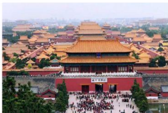
Il Palazzo Imperiale

La capitale della Cina è Pechino . Tra i luoghi più importanti che si possono visitare nella città, c'è il Palazzo Imperiale , che è molto antico. Nei dintorni di Pechino, c'è la Grande Muraglia Cinese , un muro lungo ben 21.000 Km, che attira turisti da tutto il mondo.