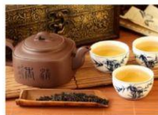
Il rito del tè

I cinesi, inoltre, sono famosi in tutto il mondo anche per la loro cucina. Tra i piatti più conosciuti, possiamo citare il riso alla cantonese , i ravioli al vapore ed il pollo alle mandorle .