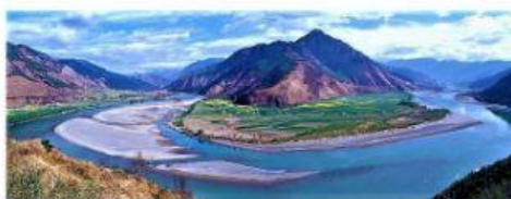
Fiume Blu Fiume Azzurro Fiume Giallo