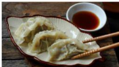
Ravioli al vapore