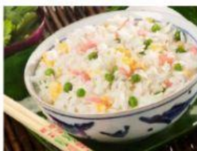
Riso alla cantonese

I cinesi, inoltre, sono famosi in tutto il mondo anche per la loro cucina. Tra i piatti più conosciuti, possiamo citare il riso alla cantonese , i ravioli al vapore ed il pollo alle mandorle .