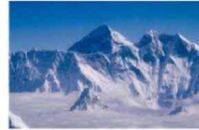
Monte Bianco Monte K2 Monte Everest