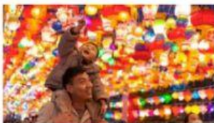
Festa dei colori Festa del papà Festa delle lanterne