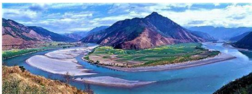
Il Fiume Azzurro

Il fiume più lungo della Cina è il Fiume Azzurro , così chiamato perché le sue acque sono limpide e trasparenti.