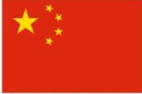
Bandiera cinese Bandiera americana Bandiera russa