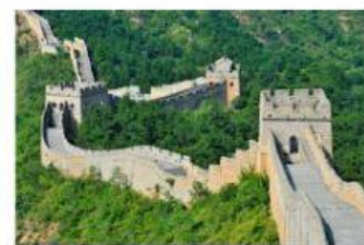
Grande muraglia tibetana Grande muraglia giapponese Grande muraglia cinese