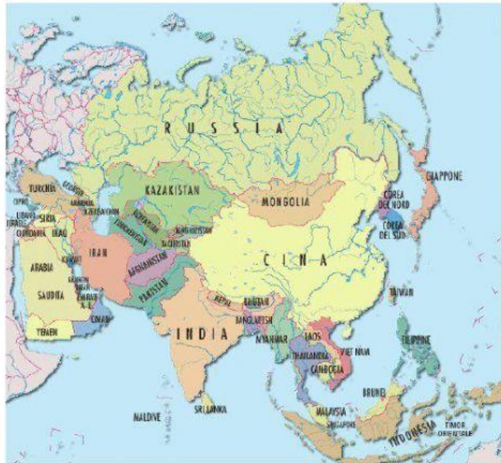
Cartina politica dell'Asia

La Cina, dopo la Russia, è lo stato più grande dell'Asia.