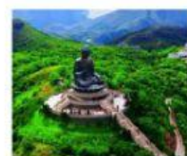
Grande Budda Grande Mago Grande Sultano