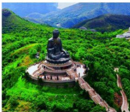
Il Grande Budda

I cinesi hanno molte antiche tradizioni, alle quali sono ancora molto legati come ad esempio il Capodanno cinese , la festa delle lanterne ed il rito del tè .