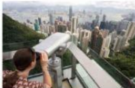
Susannah Peak Victoria Peak Amazon Peak