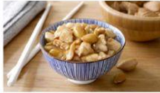
Pollo al curry Pollo alle mandorle Pollo thai