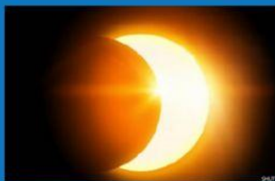
Gerhana matahari parsial