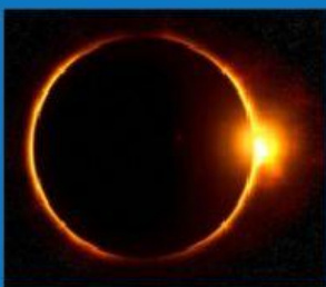
Gerhana matahari total

Gerhana matahari total hanya berlangsung kira-kira 6 menit. Gerhana matahari parsial terjadi pada bagian bumi yang masuk ke penumbra bulan. Pada saat itu, sebagian cahaya matahari masih mengenai bumi. Adapun gerhana matahari cincin terjadi jika titik umbra bulan tidak mencapai permukaan bumi. Pada gerhana ini, bagian tengah matahari tertutup bulan. Namun, bagian pinggirnya tidak tertutupi bulan sehingga tampak bercahaya.