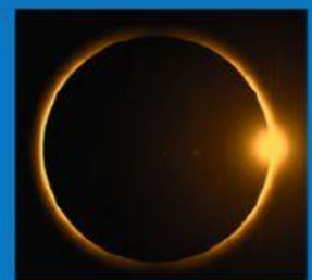
Gerhana matahari cincin