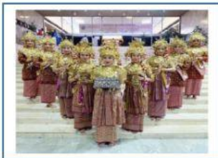
Tari Gending Sriwijaya, Sumatera Selatan