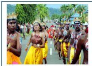
Tari Yospan, Papua

25. Video pembelajaran di atas, jodohkanlah gambar dan kata dengan tepat!