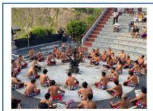
Tari Kecak, Bali