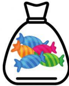
Mediana 5 dulces