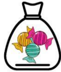
Chica 3 dulces

Completa la tabla. Anota el número de dulces que tiene en total 1, 2, 3... hasta 10 bolsas grandes, medianas y chicas.