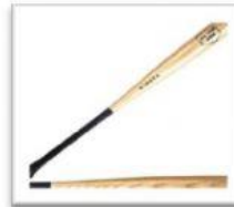
PERMAINAN BOLA KECIL