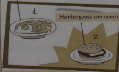
Filete de ternera con patatas