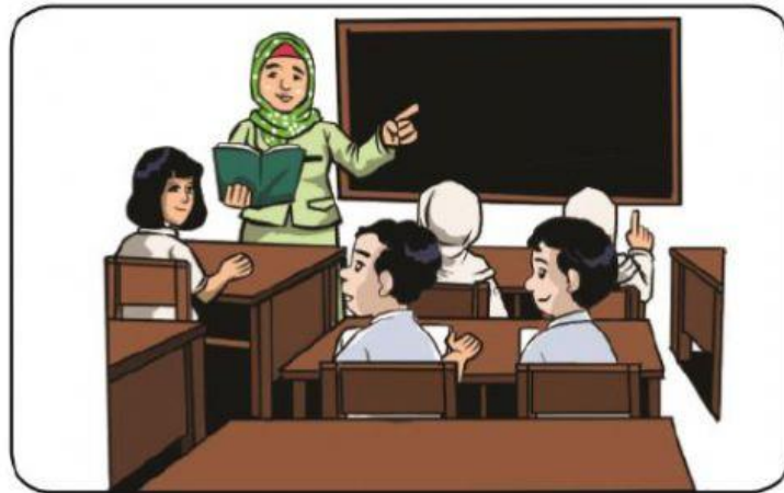
Gambar 9.6 Guru sedang mengajar peserta didik di kelas