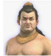
Mahapatih Gajah Mada