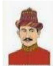
Sultan Iskandar Muda