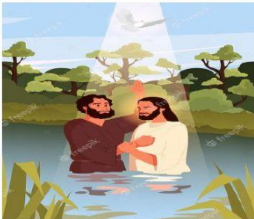
NACIMIENTO DE JESUS