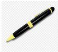
der Kugelschreiber/ die Kugelschreiber