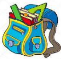
die Schultasche/ die Schultaschen