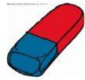
der Radiergummi/ die Radiergummis