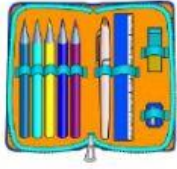
das Mäppchen/ die Mäppchen