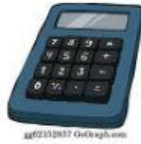
der Taschenrechner/ die Taschenrechner