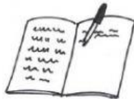
das Heft/ die Hefte