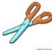
die Schere/ die Scheren