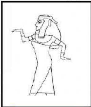
Música de Egipto