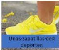
Unas zapatillas de deporte