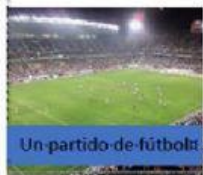
Un partido de fútbol