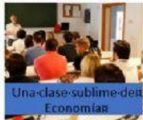
Una clase sublime de Economía

Indica si en los siguientes casos hacemos referencia a bienes o a servicios, y señala qué necesidad satisfacen.