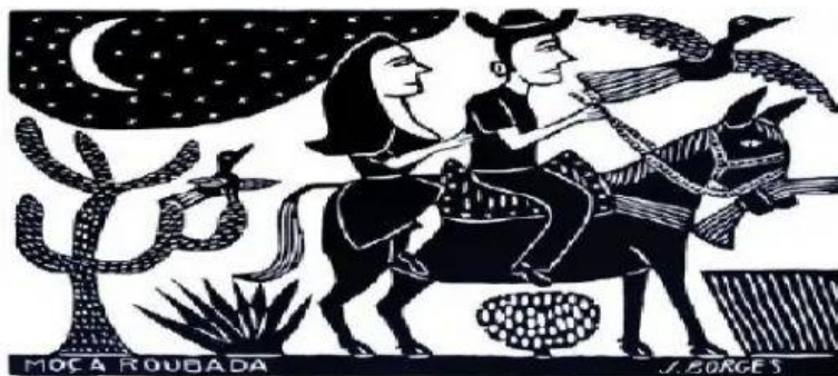
Moça Roubada, xilogravura de J. Borges.

17-Gravura é uma das técnicas mais antigas de se obter uma imagem e é muito utilizada por artistas populares nordestinos, como J. Borges. Assine a alternativa que melhor define e contextualiza a gravura