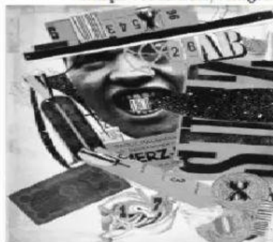
Colagem de Raoul Hausmann, 1923-1924.