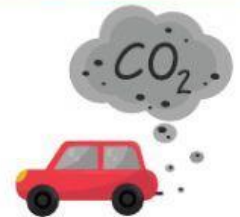
คาร์บอนไดออกไซด์