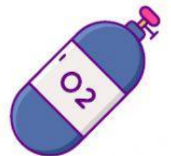
ออกซิเจน