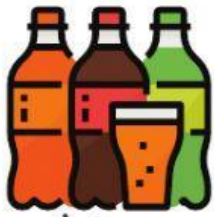
น้ำอัดลม