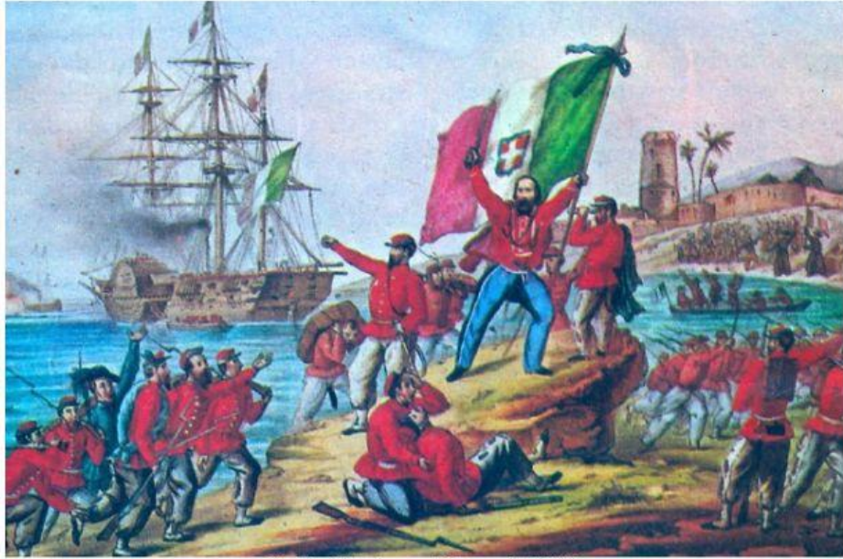
Garibaldi e la spedizione dei Mille