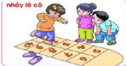
nhảy lò cò