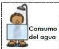
Consumo del agua