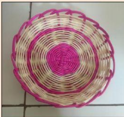
Gambar 11. Piring Rotan