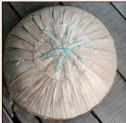
Gambar 12. Tanggui