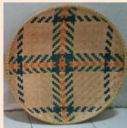
Gambar 3. Nyiru