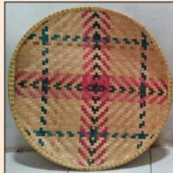
Gambar 2. Nyiru