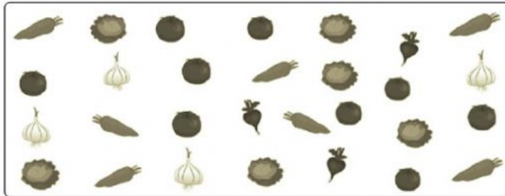
Tabla de conteo Preferencias de vegetales

1.- La imagen muestra los vegetales que eligieron los estudiantes para plantar. Completa la tabla de conteo.