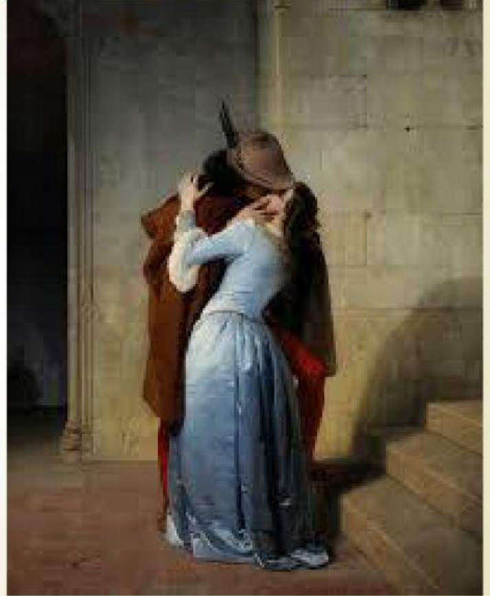
FRANCESCO HEYEZ, „ROGA I LUNEK”