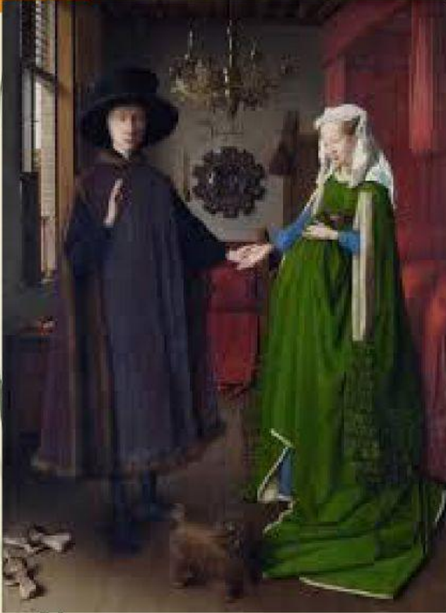
JAN VAN EYCK, „PORTRET MAŁŻONKÓW ARNOIFINICH”