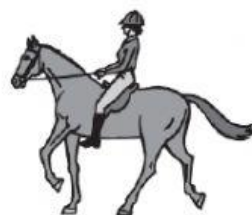
c zum Reiten.