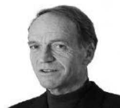
c seinen Vater