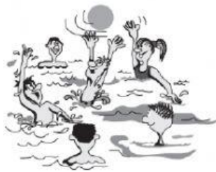
b zum Schwimmen.