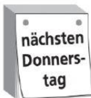
b nächsten Donnerstag.