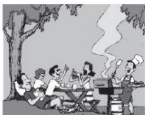
a zum Schulfest.