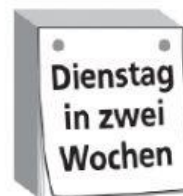
c Dienstag in zwei Wochen.