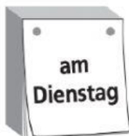
a am Dienstag.