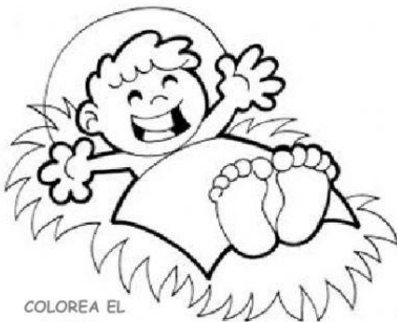
COLOREA EL DIBUJO

Consiste en el tiempo litúrgico de preparación de la Navidad. Con el Adviento empieza un nuevo año litúrgico para la iglesia. La celebración consiste en preparar la llegada del Hijo de Dios. Es la preparación para el momento de la venida. Con esta fiesta la iglesia amenizaba la espera de las Navidades, preparándose así para la llegada del que sería el Salvador. La finalidad de la celebración del adviento es, recordar la llegada del mesías, vivir el presente con las familias, y rezar para que en un futuro todo sea igual.