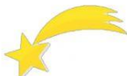
La Estrella ●

Simboliza el transcurso de las cuatro semanas de adviento. Consiste en una corona de ramas de pino con cuatro velas. Simbolizan la dignidad y el poder.