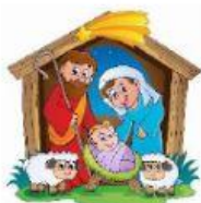
El pesebre ●

Representa el firmamento eterno donde reside la Divinidad y la Fe que debe guiar la vida del cristiano, recordando así a la estrella de Belén que iluminó el camino de los Reyes Magos.