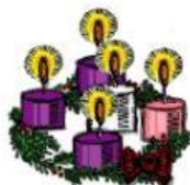
Corona de adviento ●

Recuerda el nacimiento de Jesús de forma artística.