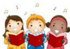
Los villancicos ●

Simbolizan la luz de Jesús que ilumina el mundo.