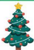
El árbol de Navidad ●

Recuerda el nacimiento de Jesús de forma artística.