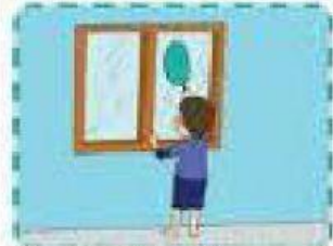
Membersihkan Kaca rumah