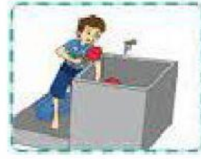
Menguras bak mandi