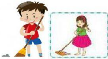
Menyapu dan mengepel lantai