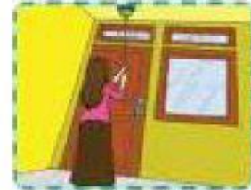
Membersihkan langit-langit rumah