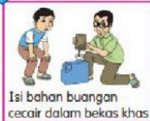
Isi bahan buangan cecair dalam bekas khas