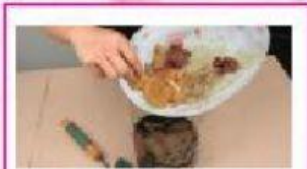
Hasilkan baja kompos menggunakan sisa makanan