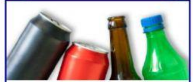
Botol kaca, plastic dan tin aluminium / logam