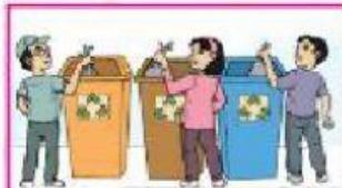
Masukkan jenis bahan buangan mengikut tong sampah yang disediakan

Bahan buangan dihantar ke pusat pengumpulan sampah