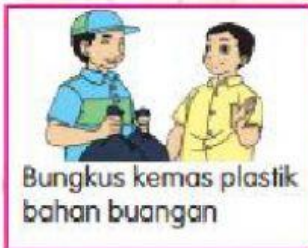
Bungkus kemas plastik bahan buangan