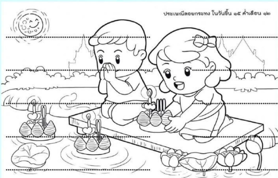
ประเพณีลอยกระทง ในวันขึ้น ๑๕ ค่ำ เดือน ๑๒

ประเพณีลอยกระทงจรรยา นำใบตองคล่องดอกไม้ใส่รวมกัน กระทงก็ลอยล่องมองสดใส สร้างเสกสรรค์กระทงน้อยร้อยดวงใจ เมื่อถึงคราต้นเดือนเย็นเพ็ญสิบสอง เพื่อส่งความสุขใจถึงทุกคน จึงเขียนกลอนบทนี้ลอยตามไป สืบทอดมาแต่โบราณนานชนชั้น