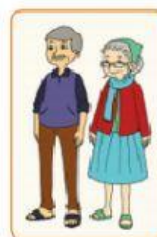
Kakek dan Nenek (Dewasa)