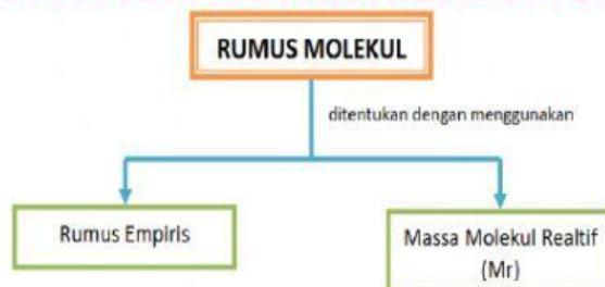
Gambar 4. Skema penentuan rumus molekul

Rumus molekul dapat ditentukan dari rumus empiris dan massa molekul relatif (Mr) zat. Seperti diketahui, rumus molekul merupakan kelipatan dari rumus empirisnya.