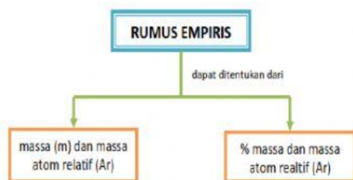
Gambar 3. Skema penentuan rumus empiris