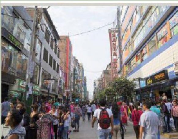
Compradores y ambulantes en el centro comercial Gamarra.

2) Observa las fotografías. Luego, describe los factores que propician situaciones de riesgo y los posibles desastres.