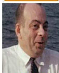
Antoine de Saint-Exupéry

2 C'est un écrivain, poète, aviateur et reporter français. Il est l'auteur du Petit Prince .