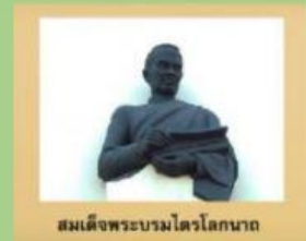
สมเด็จพระบรมไตรโลกนาถ

ให้นักเรียนบอกพระปรีชาสามารถของพระมหากษัตริย์สมัยอยุธยาให้ถูกต้อง