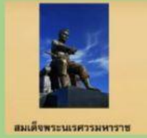
สมเด็จพระนเรศวรมหาราช