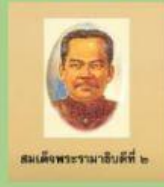
สมเด็จพระรามาธิบดีที่ ๒