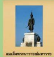
สมเด็จพระนารายณ์มหาราช