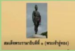
สมเด็จพระรามาธิบดีที่ ๑ (พระเจ้าอู่ทอง)