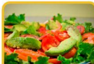
AVOCADO AND TOMATO SALAD