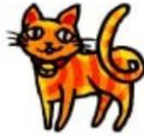
e. ねこ neko