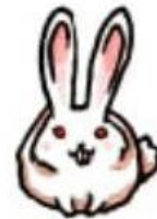
f. うさぎ usagi