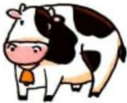
a. うし ushi