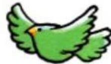
c. とり tori