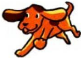
d. いぬ inu