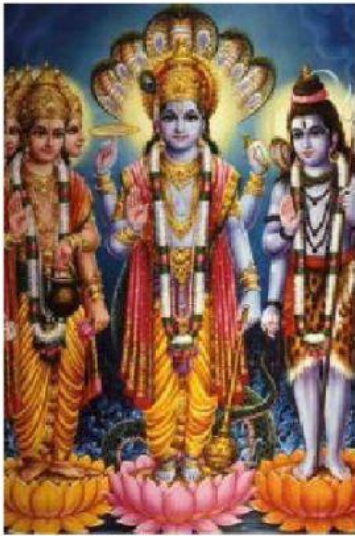
Brahma, Visnú y Shiva.

Entre las religiones más representativas se encuentran las siguientes: