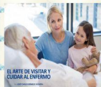
EL ARTE DE VISITAR Y CUIDAR AL ENFERMO