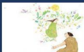
La creación del mundo