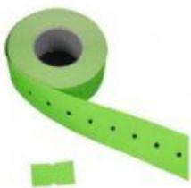
Hình 1. Giấy dán giả