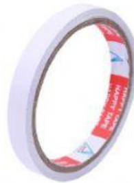
Hình 3. Keo 2 mặt