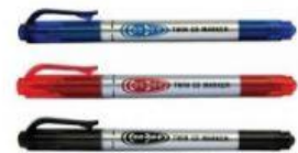
Hình 4. Bút lông

Từ các dụng cụ trên, em hãy tự lập ra quy trình tạo ra mô hình mô phỏng phân tử ADN.