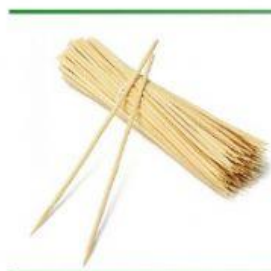
Hình 2. Tăm tre