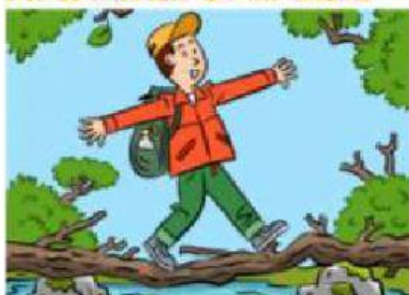
La confianza en mí mismo