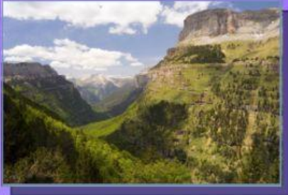
Valle de Ordesa, Huesca.