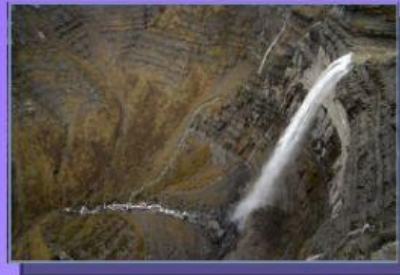
Salto del Nervión, Álava