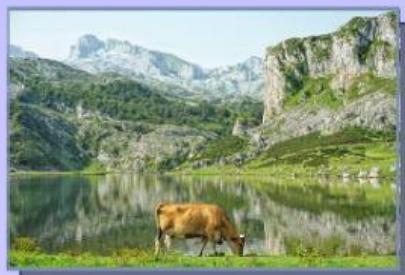
Lagos de Covadonga, Asturias