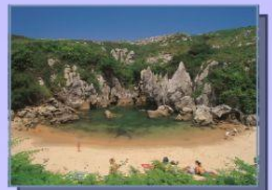
Playa de Gulpiyuri, Ribadesella