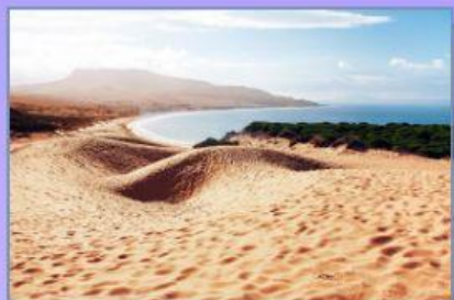
Duna de Bolonia, Cádiz