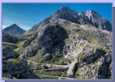
Sierra de Tramontana, Mallorca