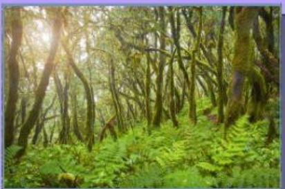
Parque de Garajonay, La Gomera