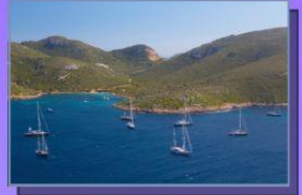
Archipiélago de Cabrera, Islas Baleares.