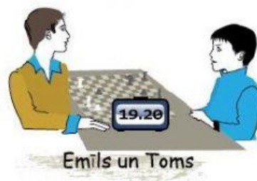
Emīls un Toms