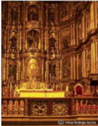
Altar de oro de la Iglesia de San Francisco. Centro histórico de Bogotá, Colombia.