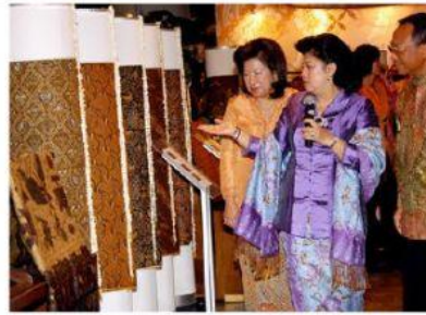
Pameran batik bertujuan untuk mengenalkan kain batik ke dunia khususnya kepada negara-negara ASEAN