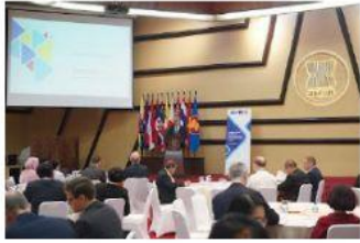
Workshop on Higher Education yang merupakan kegiatan pertemuan setiap perwakilan anggota ASEAN dalam meningkatkan mutu pendidikan negara-negara ASEAN