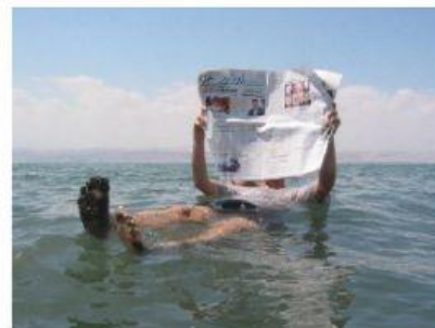
Fig.1 La mer Morte

La mer Morte est un lac très salé, bordé par la Jordanie à l'est et la Palestine à l'ouest. Dans l'eau de la mer Morte, les gens flottent sans nager. Le sel de la mer Morte est merveilleux pour la peau, il aide également à soulager les muscles endoloris et les articulations douloureuses alors que le pourcentage élevé de sel est mortel pour les animaux et les plantes aquatiques.