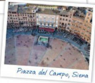
Piazza del Campo, Siena