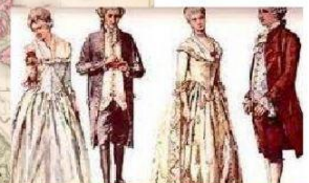
migrantes europeos "blancos"