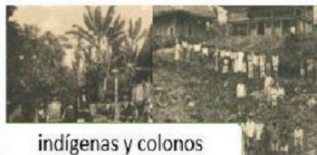
indígenas y colonos