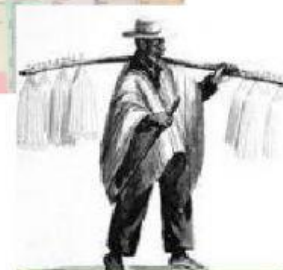
negros del Chota