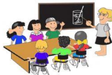
EDUCAÇÃO E CULTURA