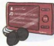
Toumini 4 GO 92,09 €