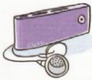
Clip & Va 1 GO 55,26 €

Observe la description de ces baladeurs mp3 et compare leurs caractéristiques.