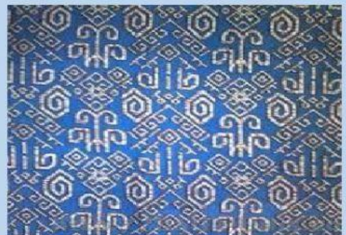
Batik Suku Asmat