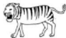
23. tiger _____ tigre