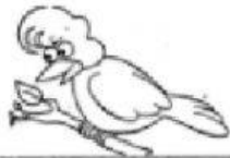
2. bird _____ pájaro