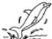
6. dolphin _____ delfin