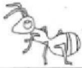
1. ant _____ hormiga