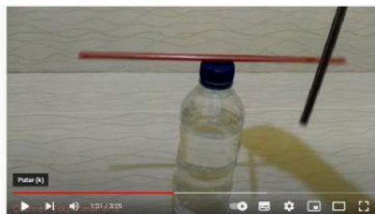
Percobaan listrik statis dengan sedotan dan botol, contoh nyata dari pembahasan listrik statis

https://www.youtube.com/watch?v=fC-vyluu0Ak&t=128s